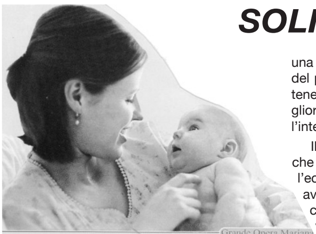
Grande Opera Mariana

«I bambini e gli anziani costruiscono il futuro dei popoli; i bambini perché porteranno avanti la storia, gli anziani perché trasmettono l'esperienza e la saggezza della loro vita». Queste parole ricordate da Papa Francesco sollecitano un rinnovato riconoscimento della persona umana e una cura più adeguata della vita, dal concepimento al suo naturale termine. E' l'invito a farci servitori di ciò che «è seminato nella debolezza» (1 Cor 15,43), dei piccoli e degli anziani, e di ogni uomo e ogni donna, per i quali va riconosciuto e tutelato il diritto primordiale alla vita 2 .