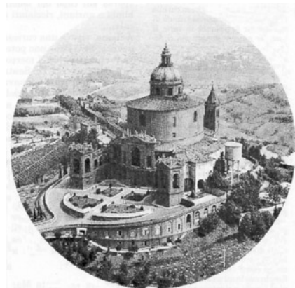
Dal Colle della Guardia la Madonna di S. Luca vigila come sentinella.

Come tutti gli anni anche quest'anno si farà. La Madonna ci aspetta anche quest'anno